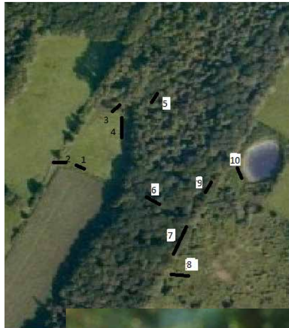
Een blauw trio: 2 ijsvogels met in het midden een boomklever

Net 10: 2x 12 meter naast grote poel met riet, wilgen en elzenhakhout