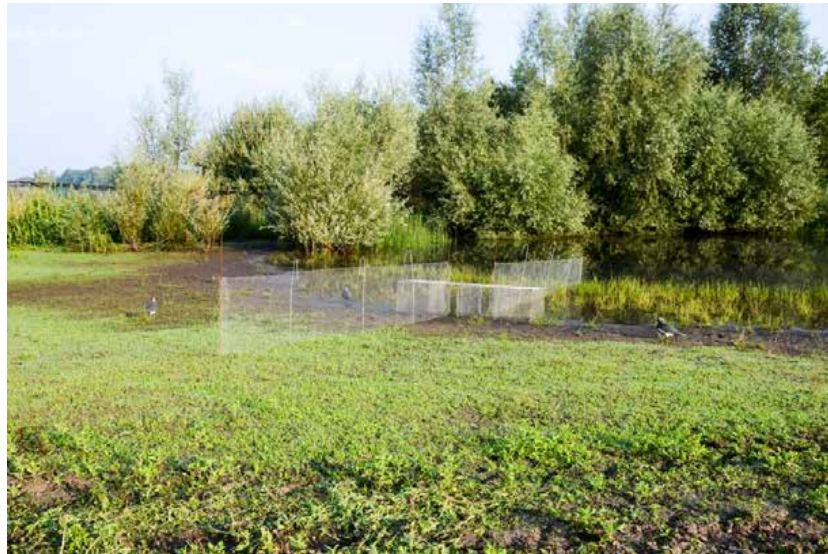
De Ottenby kooi

Buiten de CES periode is regelmatig geluid gebruikt als 'lokmiddel' om de aantallen gevangen vogels te vergroten. Dat lijkt steeds goed te werken..