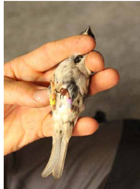
Gekleurringde huismus: metaal – paars – geel – oranje, MVYO

De leukste melding betreft een zwartkop. Op 21 maart 2019 komt bij het vogeltrekstation een melding van een zwartkop uit België. Een 1kj zwartkop is hier op 24 juni 2018 geringd met nummer BH17246. Op 27 augustus 2018 wordt deze zwartkop, dus na 64 dagen, gevangen door een ringer in Zele België, dat is 196 km verder.