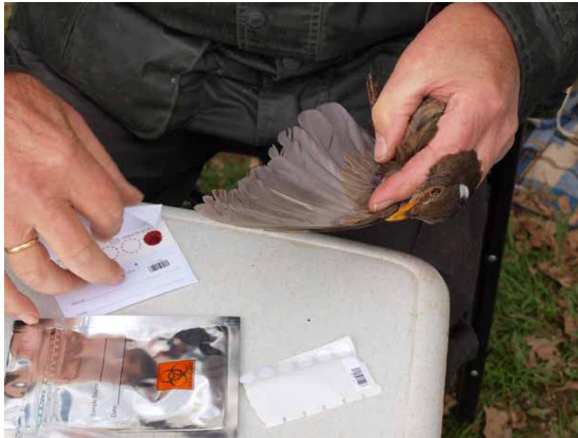
In het kader van het zoonoseonderzoek wordt er bij een merel wat bloed afgenomen