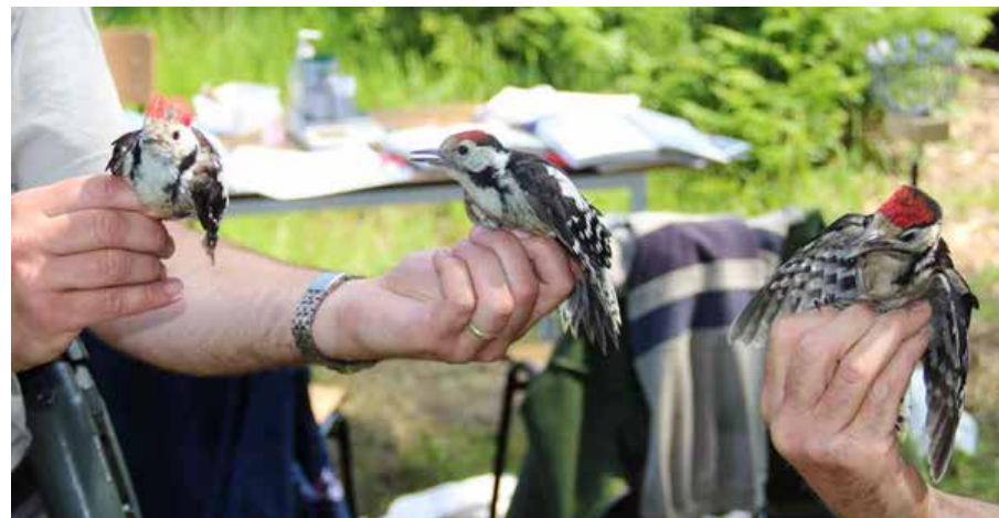
Middelste bonte spechten