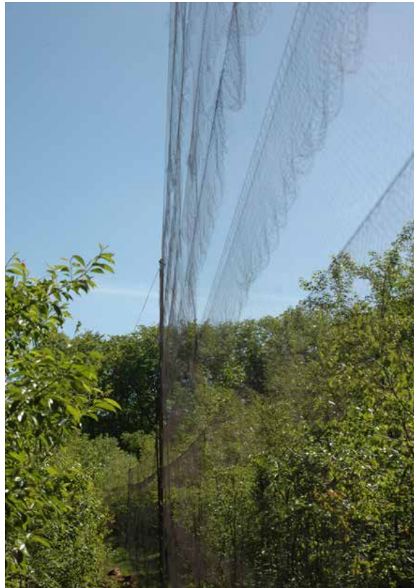
Een deel van de hijsnetten

In tabel 4 op blz. 5 nog even een overzicht van de vogels die werden gevangen in de hoge (hijs) netten ten opzichte van de vangsten in de gewone lage netten.