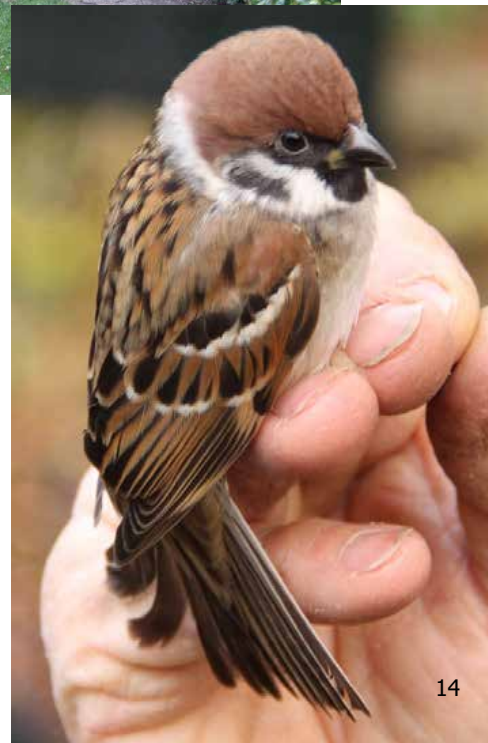
Ringmus, in 2019 weer in mooie aantallen aanwezig